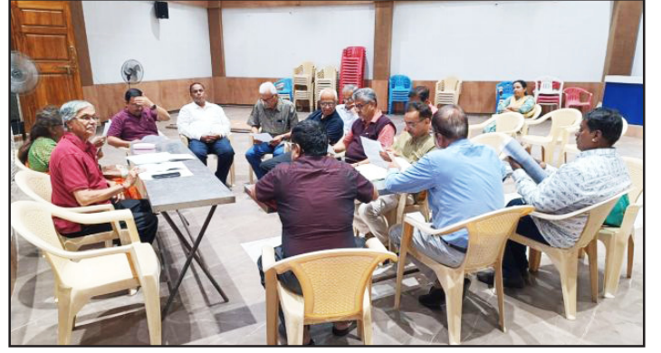
ದಿನಾಂಕ: 20-01-2025ರಂದು ಬೋರ್ಡ್ ಮೀಟಿಂಗ್ ನಡೆಯಿತು.